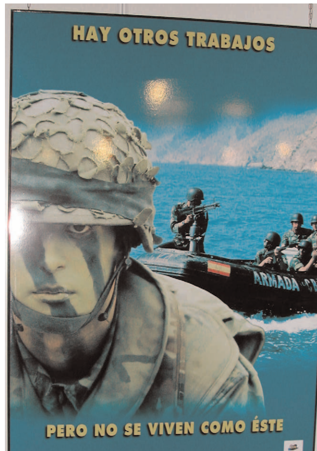
Plafò al Saló de l'Ensenyament 2005

● Finalment es podria preparar una exposició amb tots els apartats treballats al vestíbul del centre educatiu, perquè tot l'alumnat pugui informar-se'n.